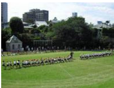
永福南小学校の校庭