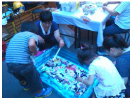
駅前での模擬店の様子