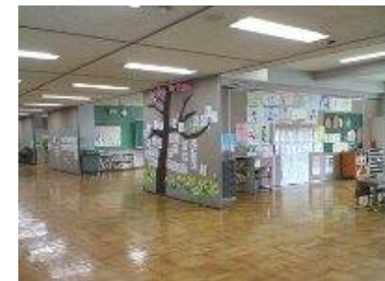
永福南小学校の校舎内